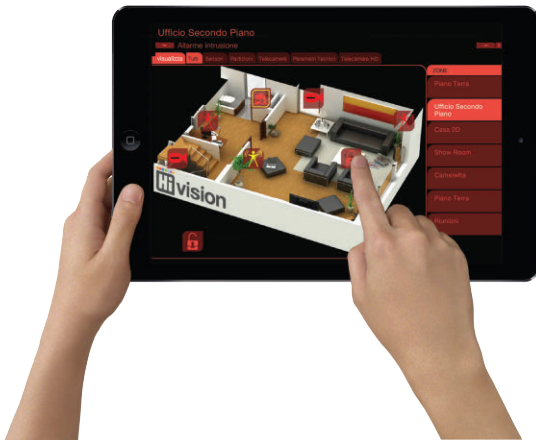
Esempio di tastiera touch WiFi. Disponibile su qualunque tablet o smartphone (iOS e Android) anche in assenza di connessione internet.